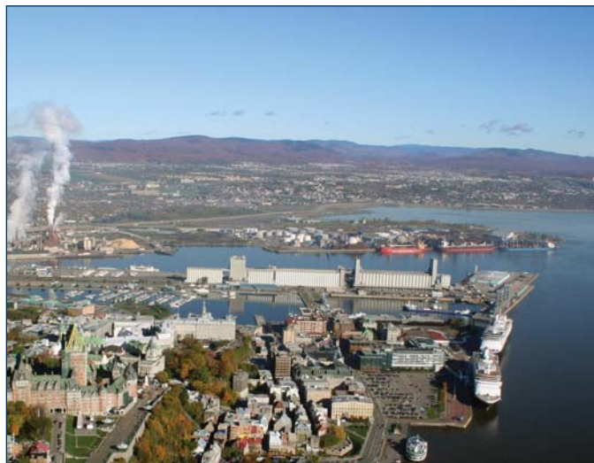
Port de Québec

Québec est née du Saint-Laurent et le Saint-Laurent a rendu possible son développement et son rayonnement à la fois historique et toujours actuel. Plusieurs projets, dont le nôtre, marquant les liens du fleuve et de la ville se dérouleront dans le cadre des célébrations du 400 e anniversaire. Notre projet démontre s'il en était besoin la place et le rôle du fleuve Saint-Laurent dans notre vie, dans notre culture et dans notre imaginaire.