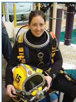
Institut maritime du Québec