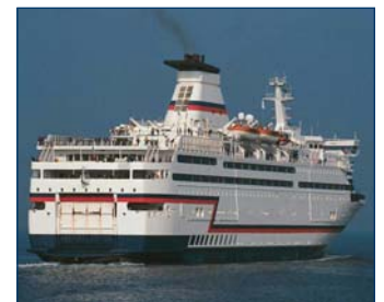
Institut maritime du Québec