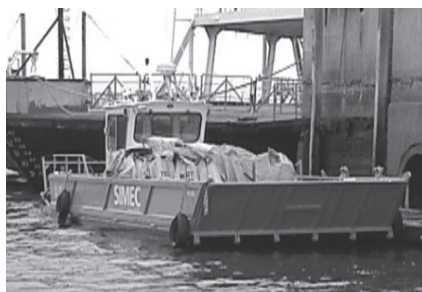
Barge d'intervention – SIMEC

Nous avons aussi souhaité faire de La Semaine de la navigation et de la relève maritime plus qu'une simple activité de promotion des formations et professions du secteur maritime. Nous avons voulu en faire un événement à même de surprendre et séduire tous les visiteurs, quel que soit leur âge et leurs attentes. Pour ce faire, nous avons invité nos partenaires à mettre à la disposition du public leurs outils de travail, ceux-là même avec lesquels la relève espérée aura à se former et à travailler. Il n'existe sans nul doute pas de meilleur moyen de sensibilisation et d'illustration à une réalité que de placer le visiteur en situation, de lui donner l'opportunité de toucher, de sentir et de questionner directement le ou la spécialiste qui en assure le fonctionnement au quotidien. Les illustrations ci-contre présentent ces « outils de travail » avec lesquels nos visiteurs ont pu prendre contact.