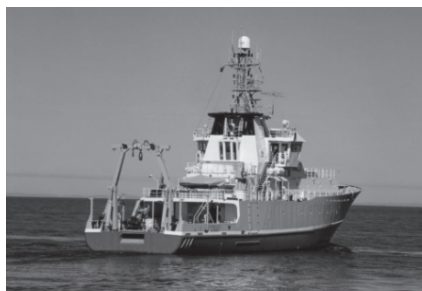
Le Coriolis II, navire de recherche océanographique Réformar – IMQ