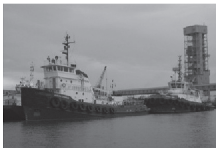
Remorqueur – Groupe Océan