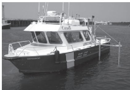
Vedette hydrographique – Service hydrographique du Canada (Institut Maurice Lamontagne) – MPO